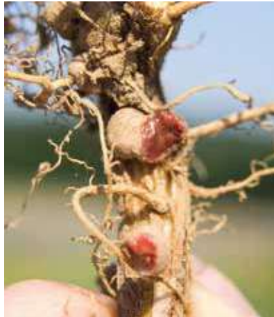
Wurzel einer mit RhizoFix® geimpften Sojabohne

Leguminosen gehen mit artenspezifischen Rhizobien (Knöllchenbakterien) eine Symbiose ein. Über die Knöllchen sind die Leguminosen in der Lage, Luftstickstoff zu fixieren. Deshalb können auch nur Leguminosen mit einem ausreichenden Knöllchenbesatz ihre optimale Leistung erreichen. Luftstickstoff stellt mit einem Anteil von 78 % an der Luft ein großes Stickstoffreservoir dar. Allerdings können die meisten Pflanzen Stickstoff nur in mineralischer Form als Ammonium und vor allem Nitrat aufnehmen. Nur Leguminosen können in Symbiose mit Rhizobien den molekularen Luftstickstoff fixieren. Um diese Symbiose zu gewährleisten, ist ein Kontakt zwischen der Wurzel und den Bakterien erforderlich. Um die Rhizobien zu den Wurzeln zu locken, scheiden diese Stoffe aus, welche die Rhizobien zu den Pflanzen führen. Über diese Stoffe erkennen die Bakterien die Pflanzenzellen und es findet eine „Infektion“ der Wurzelzelle statt. Um eine ausreichende